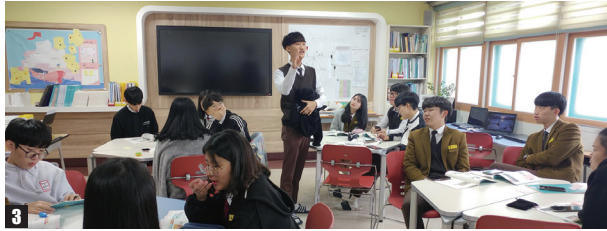
1, 2 충북 보은고는 지난해 1학년 <진로와 직업> 시간에 아두이노와 앱인벤터를 활용한 프로젝트 수업을 진행했다. 학생들은 컴퓨터 프로그래밍과 소프트웨어 등을 활용해 관심 있는 분야의 지역 사회 문제 해결 방법을 모색하는 등 깊이 있는 진로 활동을 펼친다. 3 학생들은 관심 있는 주제를 한 가지 정하고 해당 내용에 대한 자신의 생각과 배경 문제의 원인과 이로 인해 야기되는 사회적 현상 등에 관해 사전 조사한다. 이후 문제에 대한 정의를 내리고 해결책을 제시하는 발표 시간을 통해 모둠별로 의견을 나누고 토의·토론한다.

우 2학기 수업 시간을 활용해 학생 개인별로 성적을 분석하고 지원 가능 대학을 살펴보는 등 진학 상담을 실시할 예정”이라고 설명했다. 고등학교 교양 교과인 <진로와 직업>은 성적 산출 없이 Pass/Fail로만 평가한다.