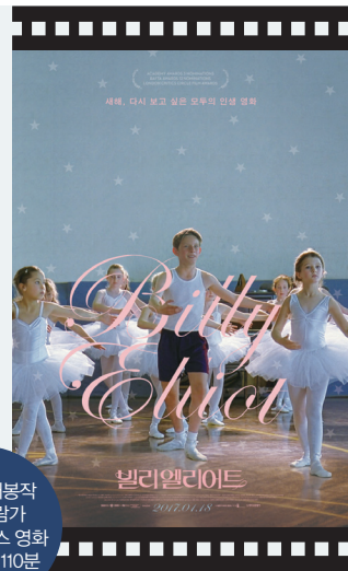
2001년 개봉작 12세 관람가 영국·프랑스 영화 상영 시간 110분

요약 #세상의 편견에 맞선 빌리의 용기에 박수 #자식이기는 부모 없다? #너도 네 꿈 찾아가라 즐거리 11살 소년 빌리는 복싱을 배우러 가는 체육관에서 우연히 발레 수업을 엿본 후 토슈즈를 신고 발레리노의 꿈을 꾸지만 탄광촌 광부인 아버지의 반대에 부딪혀 절망한다.