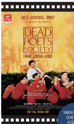
1990년 개봉작 12세 관람가 미국 영화 상영 시간 128분

한 줄 평 “코믹 영화를 좋아하지만 감동과 깊은 울림 그리고 여운을 남기는 이 영화도 너무 좋았어요.” “아들의 춤 실력을 직접 본 아버지가 비로소 아들의 재능을 이해하는 장면이 기억에 남아요.” “영국 북부 탄광촌 노동자로 힘겹게 일하면서 아들의 예술 뒷바라지를 결심하는 아버지를 보고 눈물이 났어요.”