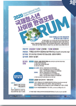
2020 국제청소년 사이버 환경포럼 YOUTH.ENCYNET.ORG

아시아기후변화교육센터와 제주도가 주최하는 청소년 사이버 환경포럼이 10월 5일까지 참가자를 접수 받는다. 사이버 환경포럼은 환경 보전을 위한 청소년의 역할에 대해 고민해보고 다양한 주제로 발표하며, 환경 정보를 공유해 환경 문제 해결 능력을 키워보는 온라인 토론회의 장이다. 올해는 'COVID-19와 우리의 미래'에 대해 제안서를 작성해 온라인상에 올리고, 댓글을 이용해 토론에 참여하면 된다. 9월 24일까지 제안서를 제출하면 멘토링도 받을 수 있다.