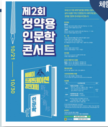
제2회 정약용 인문학 콘서트 JCONCERT.ORG

조선시대 위대한 실학자이자 유네스코 세계기념인물인 다산 정약용의 인문정신을 계승하기 위한 인문학 콘서트가 10월 21일부터 열흘 동안 열린다. 주제에 다각적으로 접근해 자신만의 창의적이고 참신한 생각을 에세이로 작성해 발표하는 대회로, 올해 주제는 '1700~1800년대 세계를 움직인 세계사적 인문의 사상이 우리에게 어떤 가치와 의미를 갖는가. 자세한 에세이 작성 방법은 홈페이지에서 확인 가능하며, 지난해 수상작도 열람할 수 있다.