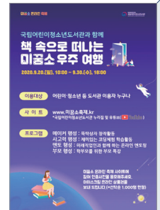
미꿈소 온라인 축제 WWW.미꿈소축제.KR

국립어린이청소년도서관에서 9월 20일부터 30일까지 열흘 동안 '미꿈소 온라인 축제'를 개최한다. '책 속으로 떠나는 미꿈소 우주여행'이라는 주제하에, '사고령 행성'에서는 게임으로 코딩을 체험한다. '민토 행성'에서는 4차 산업혁명 시대에 부상한 미래 직업인 로봇공학자, 빅데이터 전문가, 유전상담사 멘토들에게 생생한 직업 체험 얘기를 듣는다. 부모 특강이 마련된 '부모 행성'에서는 과학 분야 작가에게 아이들과 나눌 수 있는 우주에 관한 지식을 전수받는다. 온라인 축제 인증 사진을 올리거나 설문에 참여한 선착순 1천 명에게는 경품을 증정한다.