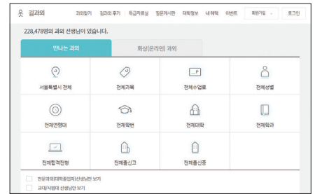
다양한 검색 조건으로 원하는 선생님을 찾아볼 수 있어요.