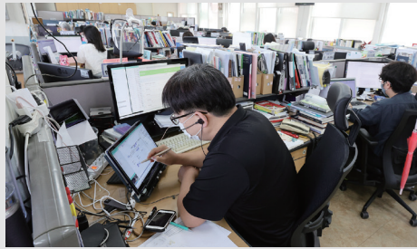
코로나19 확산으로 원격 수업을 실시하고 있는 서울의 한 고등학교 교무실 모습.

학생들의 식습관과 생활 리듬도 불규칙해진 것으로 조사됐다. 중학생 51.9%와 고등학생 60.5%가 코로나19 이후 ‘더 늦게 잔다’고 답했다. 또 중학생 58.0%, 고등학생 67.5%가 ‘더 늦게 일어난다’고 했다. 식습