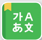
네이버 사전 (영어단어장)

네이버 영어사전에서 검색한 단어를 바로 단어장에 추가해서 학습할 수 있어 유용하다. 단어장에 있는 단어는 암기한 단어와 암기하지 못한 단어로 구분돼 미암기 단어에 대한 효율적인 학습 또한 가능하다.