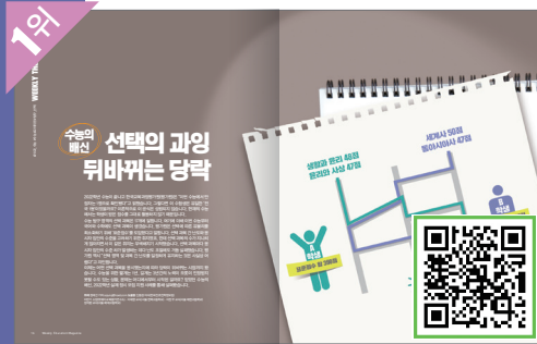
QR코드 찍고 기사 보러 가기

“ ‘2022학년 수능 만점자가 유일한 ‘전국 1등’이 아니다?’ 충격적인 서두로 시작한 이 기사는 2022학년 실제 정시 모집 사례를 통해 불합리하고 불공정한 수능의 민낯을 파헤쳤습니다. 올해도 같은 구조인 수능에도 전해야 하는 수험생들은 특히 기사의 다양한 함몰 사례와 주요 대학·학과의 교차지원 참고점을 대입 준비에 활용하면 좋을 것 같습니다. ”