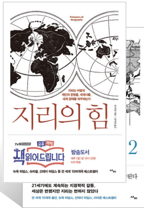
지리의 힘 1, 2 지은이 팀 마샬 옮긴이 김미선 퍼낸곳 사이

고1 <통합사회> 수업을 들으며 읽었던 <지리의 힘>을 추천합니다. 책 관련 TV 프로그램에서 소개돼 유명해진 책이기도 하죠. 개인적으로 이 책은 <세계지리> 내용을 기반으로 국제정치를 이야기한다고 생각해요. 지리와 정치를 연계한 지정학을 접할 수 있죠. 다만, 고1이 읽기엔 좀 어려워요. 대학 면접 때도 비슷한 질문을 받았는데, 고교 입학 전에 지리와 국제정치·외교에 관심이 커서 큰 어려움은 없었다고 답한 기억이 나요. 후배들은 다른 지리 선택 과목을 들은 후에 봐도 좋아요. 지리학과는 물론, 정치·외교 분야에 흥미 있는 학생들이 읽어보면 좋을 내용도 많습시다.