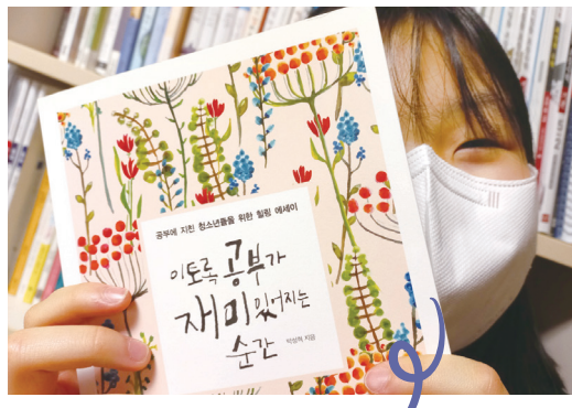
중딩이의 '갓생' 살기~ 공부하고 싶은 마음을 열어주는 책으로 시작!