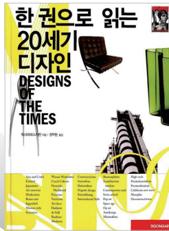
한 권으로 읽는 20세기 디자인 지은이 락시미 바스카란 옮긴이 정무환 펴낸곳 시공아트

산업혁명 이후부터 오늘날까지 등장했던 수많은 디자인 양식을 시대별로 정리한 책입니다. 바우하우스를 거쳐 조너선 아이브까지, 근현대 대표 거장들의 시대를 흥미한 디자인을 훑어보며, 각 양식의 주요 특징·발전 과정을 체계적으로 이해할 수 있어요.