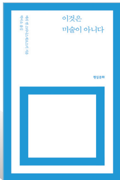
이것은 미술이 아니다 지은이 메리 앤 스타니스제프스키 옮긴이 박이소 펴낸곳 현실문화연구

특히 각 챕터 마지막에 과거의 양식이 후대에 어떻게 응용됐는지, 오늘날의 디자인 사례로 보여줍니다. 좋은 선례를 읽고 보는 것만큼 훌륭한 레퍼런스는 없어요. 거장들이 어떻게 과거의 해법을 현재에 접목했는지 알 수 있거든요. 또한 이 책은 시각, 건축, 가구, 운송 등 디자인의 거의 모든 분야를 포괄적으로 소개해줘, 한 권으로 시야와 견문을 넓힐 수 있어요. 디자인 학도라면 꼭 한 번 읽어보길 추천합니다.