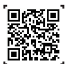
QR코드 찍고 추천 영상 바로 보기

에펠탑, 피사의 사탑, 타지마할, 그리고 남산타워까지... 많은 사람들이 알고 있는 전 세계 랜드마크에는 아무도 몰랐던 비밀이 있다. 에펠탑 야경에는 저작권이 있기에 에펠탑 야경 사진을 찍어 개인 SNS에 올리는 건 엄밀히 따지면 불법 복제 행위에 해당한다. 또 기울어진 모습으로 유명한 피사의 사탑은 보수공사를 거친 후 명성과 달리 오히려 조금씩 바로 세워지고 있는 중이었는데, 그렇다면 우리나라의 남산타워에 얽힌 비밀은 무엇일까? 궁금하다면 영상을 클릭해보자. @